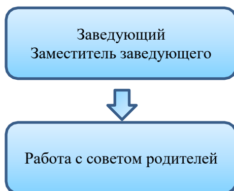
Схема взаимодействия с семьями воспитанников

Педагоги самостоятельно выбирают педагогически обоснованные методы, приемы и способы взаимодействия с семьями обучающихся, в зависимости от стоящих перед ними задач. Сочетание традиционных и инновационных технологий сотрудничества позволит педагогам ДООУ устанавливать доверительные и партнерские отношения с родителями (законными представителями), эффективно осуществлять просветительскую деятельность и достигать основные цели взаимодействия ДООУ с родителями (законными представителями) детей дошкольного возраста.